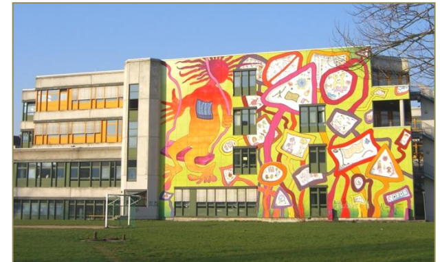
Mural-Global-Projekt an der Elisabeth-Knipping- Schule Kassel