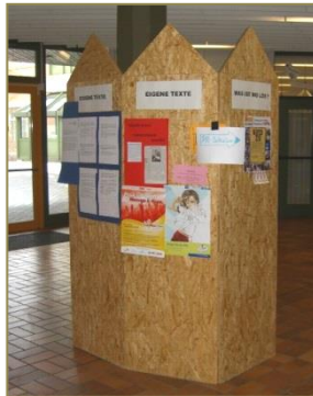
Fachbereich Deutsch: Litfasssäule

Mittagstisch in der „ess-bar“: Salattheke