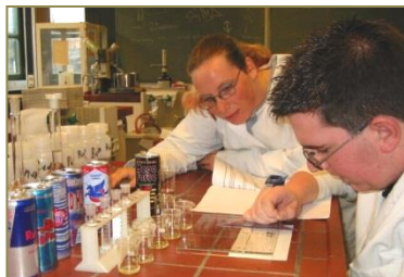
Biologie- und Chemietechnik: besondere Anschaffungen